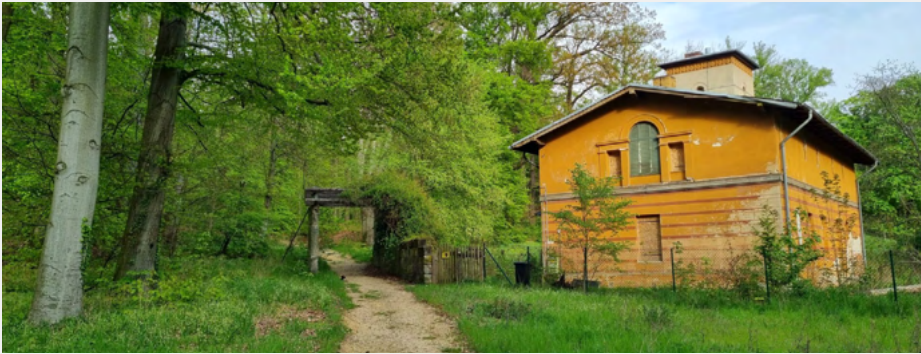
Matrosenhaus im Landschaftspark Klein-Glieneke